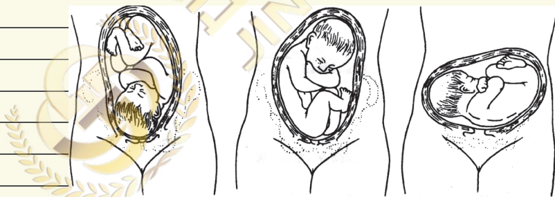
(1) 纵产式-头先露 (2) 纵产式-臀先露 (3) 横产式-肩先露

胎体纵轴与母体纵轴的关系称胎产式。两纵轴平行称纵产式; 两纵轴垂直称横产式(胎儿横着的)。